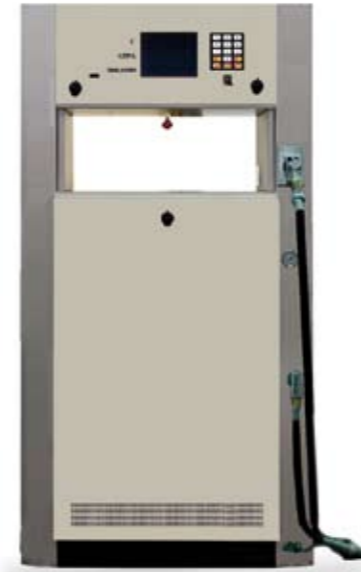
Σειρά M-5200 LPG Πιστοποίηση κατά: ATEX 94/9/EC & MID 2004/22/EC Ex CE ΑΡΙΘΜΟΣ ΕΓΚΡΙΣΗΣ Φ2-252-2012

Ο LPG διανομέας της σειράς M5200 αποτελεί προϊόν υψηλής ποιότητας και είναι ειδικά κατασκευασμένος για την διανομή Υγραερίου σύμφωνα με την Ελληνική Νομοθεσία και τις Διεθνείς προδιαγραφές.